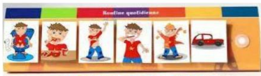
Planificateur de routine

Certains enfants ont besoin de voir sur un support attractif les différents moments de leur journée.