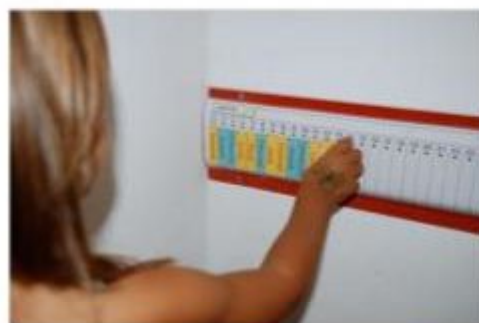
Poutre du temps

Les repères de la journée sont intégrés ? L'enfant peut apprendre à se repérer dans l'année, grâce à une frise mural (poutre du temps) représentant tous les jours de l'année. Les événements importants peuvent y être représentés (anniversaires, vacances, rentrée des classes...).