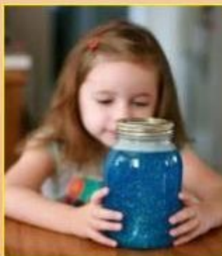
“La bouteille de retour au calme”